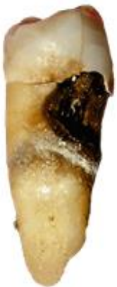
Carie dentaire. Image Wikipedia Commons. Photo credit: Lycaon.

La carie dentaire est une des maladies les plus fréquentes au monde et peut être provoquée par de nombreuses bactéries dont Streptococcus mutans . En se multipliant les bactéries produisent de l'acide qui peuvent endommager et faire des trous dans les dents. Cela peut faire mal et peut entraîner la perte des dents. On peut se rendre compte qu'on a une carie surtout lorsqu'on a mal aux dents, une douleur en buvant des liquides chauds et froids.