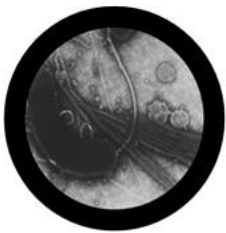
Vibrio cholerae

Le choléra est une infection intestinale provoquée par la bactérie Vibrio cholerae qu'on peut attraper au cours d'un voyage. Le Choléra peut donner de la diarrhée et dans les cas graves entraîner la mort. Les bactéries se propagent dans l'eau infectée qui a été contaminée par des selles.