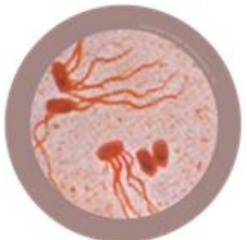
Salmonella typhi

La fièvre typhoïde existe dans des pays à faible niveau d'hygiène. Elle est due à la bactérie Salmonella typhi qui vit dans l'intestin et se transmet par les selles. Dans certains pays les bactéries peuvent se trouver dans l'eau. Les personnes atteintes de fièvre typhoïde ont une forte fièvre, des maux de tête, des courbatures et de la diarrhée. Il existe un vaccin contre la fièvre typhoïde, et on peut également la soigner avec des antibiotiques