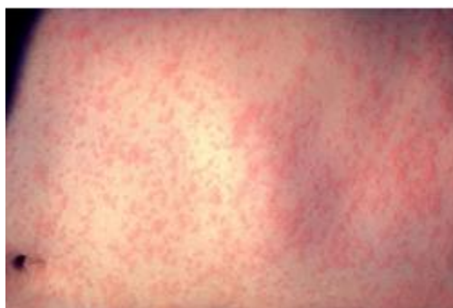
Éruption de la rougeole sur le ventre.

Bien qu'elle soit rare en France, la rougeole tue environ un million d'enfants à travers le monde chaque année. Heureusement, il y a un vaccin qui est administré quand on est petit et qui empêche de l'attraper.