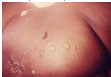
Impetigo de la fesse chez un enfant.