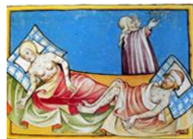
Illustration de la Peste Noire dans la bible de Toggenburg (1411)