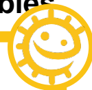
Gráfico para un cepillado de dientes saludable