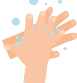
Por detrás de las manos