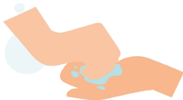
Por detrás de los dedos