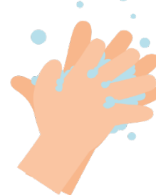
Entre los dedos