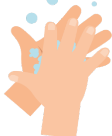
Palma contra palma