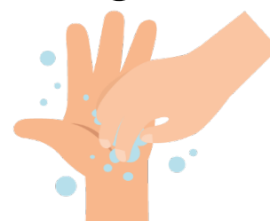
Las puntas de los dedos

Para ayudarte con el tiempo, canta dos veces el “Cumpleaños Feliz”