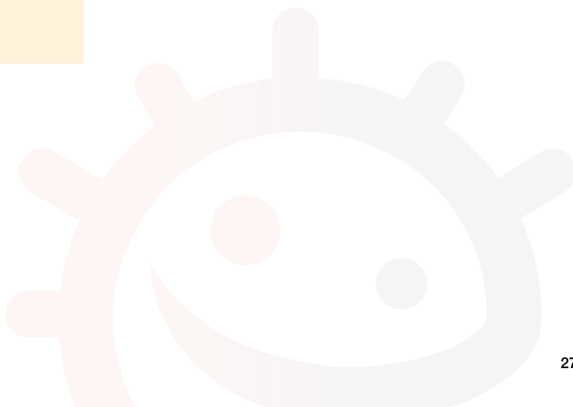
EA1 Friske tenner (tannpussediagram)